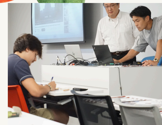
交流活动，文化探访