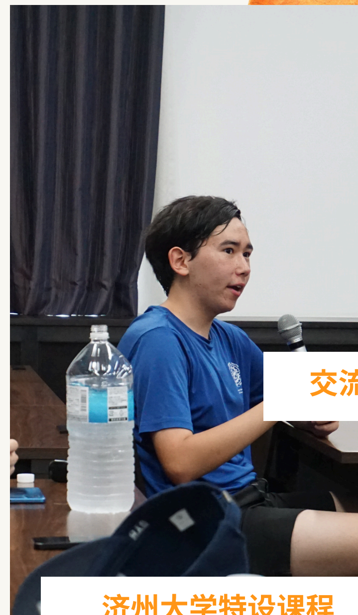
济州大学特设课程